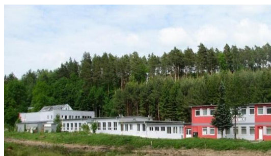
Výrobní závod společnosti Media Mix s.r.o.

S akvizicemi nicméně nekončíme. Pro první kvartál připravujeme koupi dalších tří společností. Velmi brzy tedy překonáme hranici jedné miliardy v čisté hodnotě vlastněných společností . Aktuální přehled celého portfolia včetně detailnějších informací o jednotlivých společnostech najdete na našem webu v sekci Naše firmy .